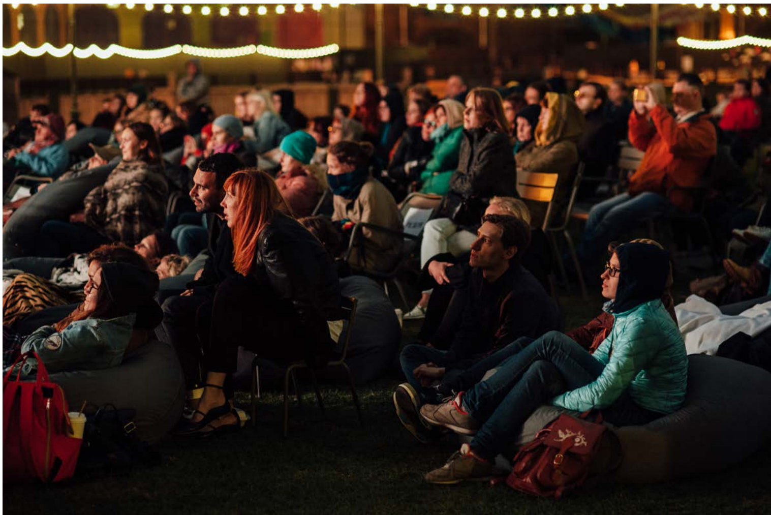
Показ фильма «Осколки», осень 2017.