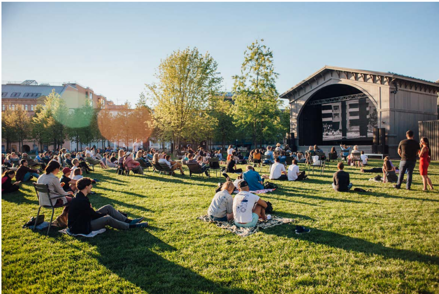
Beat Film Festival , лето 2017. Фотограф Катя Никитина