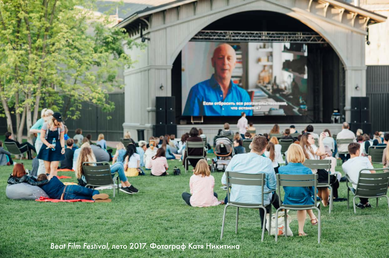
Beat Film Festival, лето 2017. Фотограф Катя Никитина

Архив фотографий в высоком разрешении по ссылке: