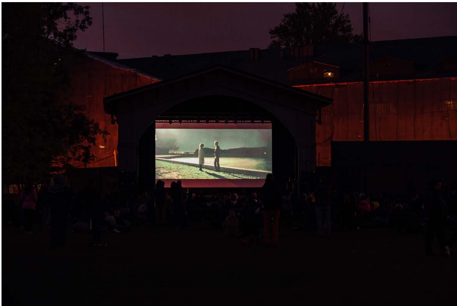
Показ фильма «Осколки», осень 2017.