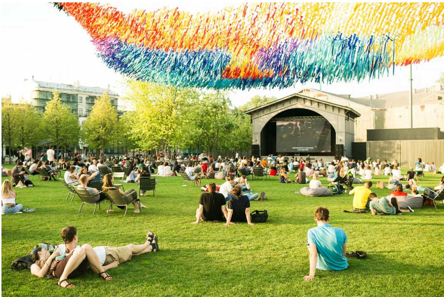
Фестиваль британского документального кино, лето 2017.