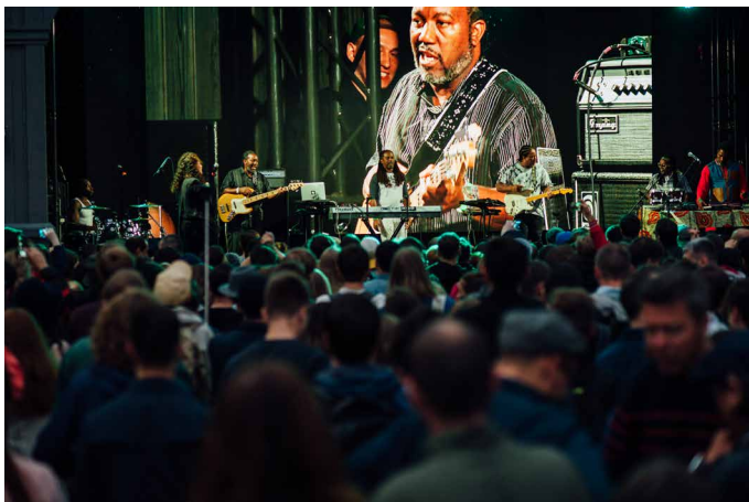
Концерт Digable Planets , лето 2017