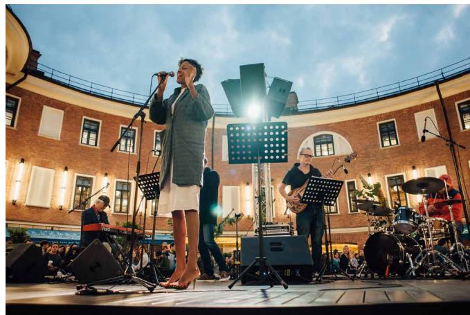
Концерт Electric Project Андрея Кондакова, лето 2017