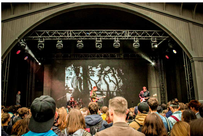
Концерт Могота , лето 2017