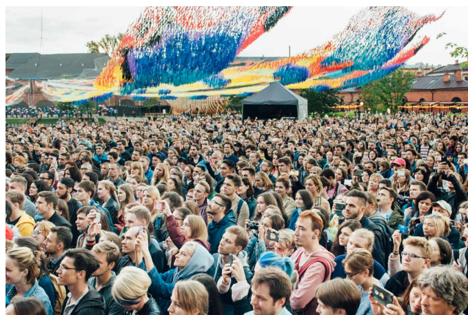
Концерт London Grammar , лето 2017