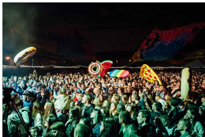
Концерт СБПЧ, лето 2017