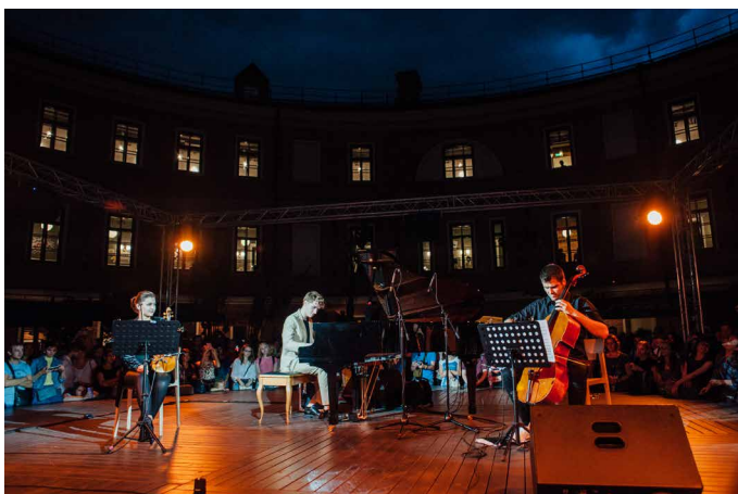
Концерт Кирилла Рихтера, лето 2017