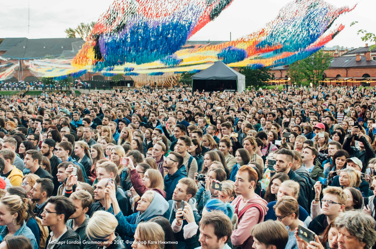
Концерт London Gramma, лето 2017. Фотограф Катя Никитина

Архив фотографий в высоком разрешении по ссылке: