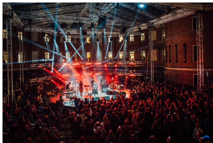
Концерт «Зоркий & The Ladies», лето 2017